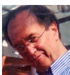
PIETRO DECESTINA TEORIA RITMO E PERCEZIONE MUS.