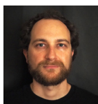
MATTEO CRISTOFORI CHITARRA ELETTRICA ARMONIA